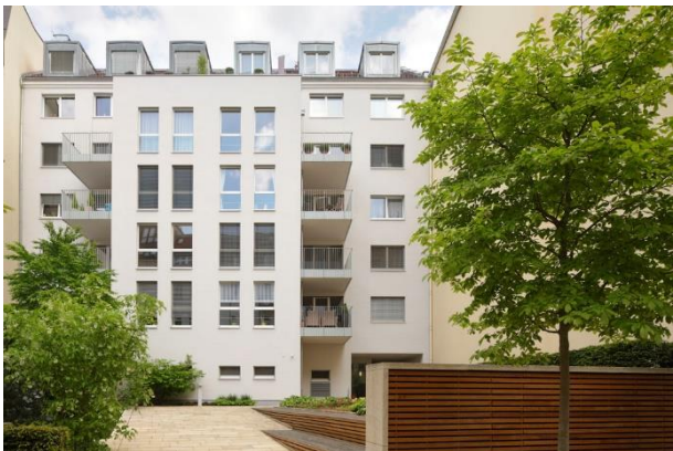
Fassade zum Innenhof