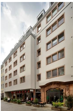
Fassade zur Klostersgasse