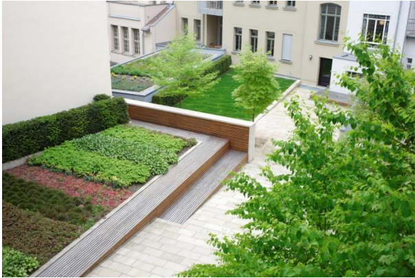
Blick vom Balkon in den begrünten Innenhof [Abb. ähnlich]